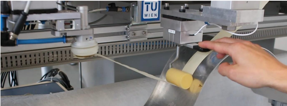
Abbildung 2: Zusammenarbeit von Mensch und Maschine beim Aufkleben eines Klebestreifens.

Die Arbeiten finden auch im internationalen Wissenschaftsbetrieb großen Anklang wie dies durch den Mechatronics Paper Prize Award 2020 für einen Beitrag im Journal Mechatronics aus dem Jahr 2018 und der jüngsten Veröffentlichung in der IEEE Transactions on Robotics bestätigt wird. „Durch die enge Zusammenarbeit zwischen der TU Wien und dem AIT versuchen wir die Ergebnisse der Grundlagenforschung sehr schnell in den Markt zu bringen und für die industrielle Praxis effektive Lösungen zu erarbeiten. Die Arbeiten an der TU Wien fokussieren sich dabei sehr stark auf den Bereich der grundlagenorientierten Methodenentwicklung und am AIT versuchen wir systematisch den Reifegrad der entwickelten Technologien zu erhöhen.“ erklärt Andreas Kugi. „Die Produktionstechnik und der Einsatz flexibler, lernfähiger und adaptiver robotischer Systeme wird sich in den nächsten Jahren kontinuierlich weiterentwickeln und zum Teil massiv verändern“, ist er weiters überzeugt. „Darin sollten wir eine Chance sehen und die Entwicklung aktiv mitgestalten.“